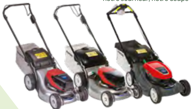
HRG 416 XB | HRG 466 XB | HRX 476 XB

Légères, robustes et faciles à utiliser, les tondeuses à batterie HONDA peuvent tourner dans les espaces les plus exigus grâce à leur ligne compacte. La gamme donne le choix entre machine poussée ou autotractée, ramassage ou mulching. De plus, les batteries sont compatibles avec notre souffleur, notre coupe-bordure et notre taille-haies à batterie.